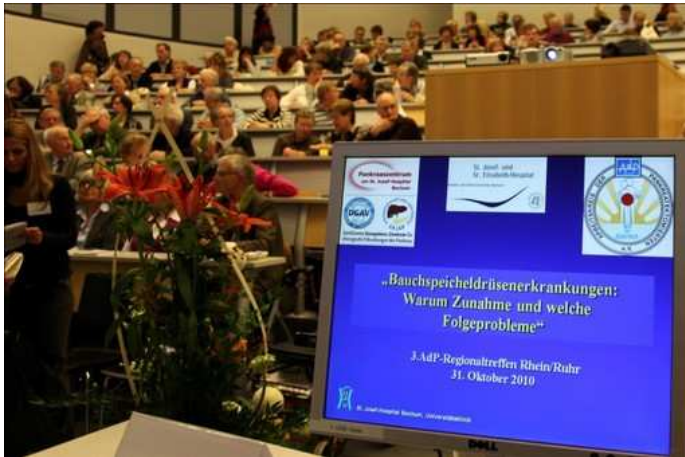
3. AdP-Regionaltreffen Rhein/Ruhr