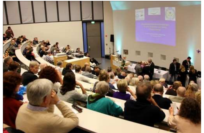
Der gefühlte Hörsaal des St. Josef-Hospital Bochum